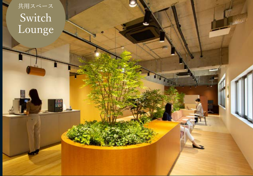
共用スペース Switch Lounge