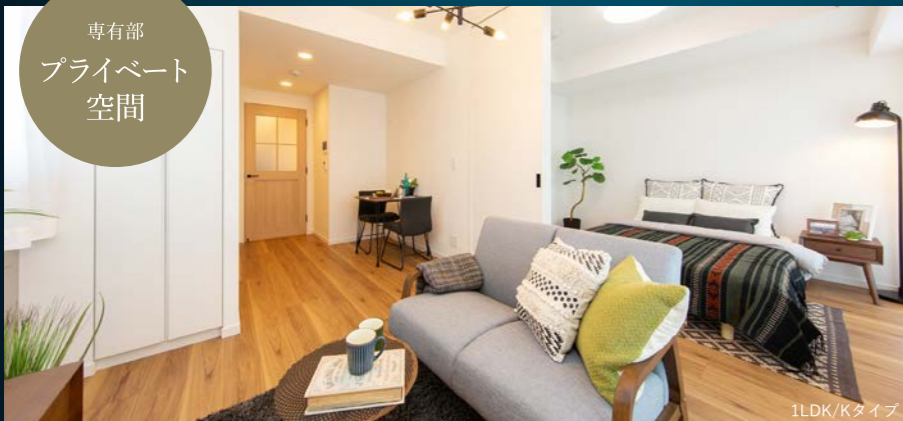
専有部 プライベート空間