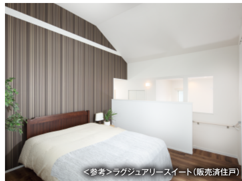
<参考>ラグジュアリースイート (販売済住戸)